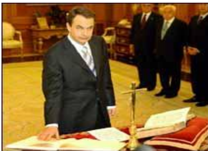
Presidente de España José Luís Rodríguez Zapatero