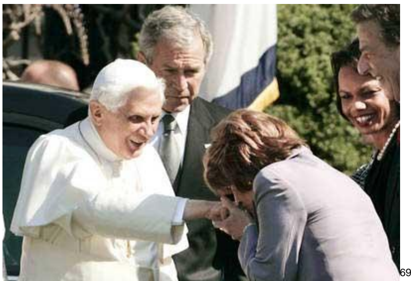
Nancy Pelosi, presidenta de la Cámara de Representantes, besa el anillo del papa Benedicto XVI durante el encuentro con la cúpula política estadounidense en la Casa Blanca; el mandatario

Por lo cual pido a Dios y los santos me ayuden. Amén. 68