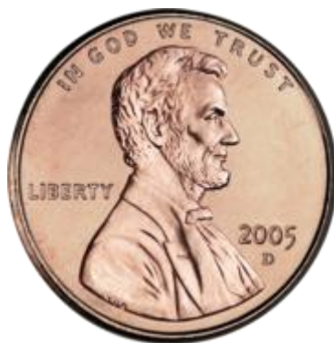
Moneda de un centavo con el lema “ En Dios Confiamos ” 60

El surgimiento del Estado moderno se da a partir de la transición de un mundo teocrático a un mundo antropocéntrico. Es decir, se abandona la idea de que todo poder proviene de la divinidad, para sostener que el hombre es el centro de todas las cosas: el poder proviene del pueblo.