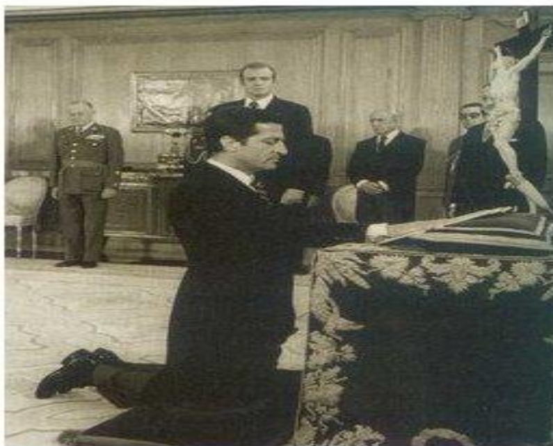
El Rey Juan Carlos y el Presidente Adolfo Suárez (España)